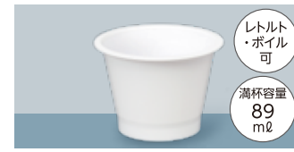
製品名 TS 71-50-89 サイズ 口径:71.0 全高:50.0 (mm) 首下径:63.2 底径:45.2 ケース入数 1,800 個 加飾 インモールドラベル