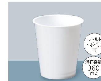
製品名 SK 88-98-360 サイズ 口径:87.0 全高:97.8 (mm) 首下径:80.4 底径:60.2 ケース入数 444 個 加飾 インモールドラベル