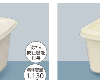
製品名 TS 1kg(長方形) サイズ 口径:180.0×128.5 全高:63.0 (mm) 首下径:171.5×118.5 底径:142.5×98.0 ケース入数 本体250 個 / 蓋500 個