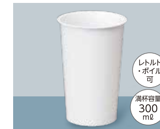
製品名 TS 75-112-300 サイズ 口径:74.3 全高:111.5 (mm) 首下径:68.3 底径:55.2 ケース入数 528 個 加飾 インモールドラベル