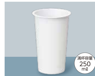
製品名 TS 71-110-250 L サイズ 口径:70.4 全高:110.0 (mm) 首下径:63.3 底径:48.9 ケース入数 700 個 加飾 インモールドラベル