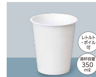
製品名 TS 88-98-350 サイズ 口径:86.7 全高:97.6 (mm) 首下径:80.0 底径:60.0 ケース入数 840 個 加飾 インモールドラベル