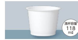
製品名 TS 71-53-118 サイズ 口径:70.1 全高:52.7 (mm) 首下径:63.2 底径:50.6 ケース入数 1,560 個 加飾 ダイレクト印刷