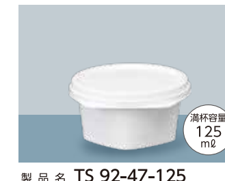
製品名 TS 92-47-125 サイズ 口径:92.4 全高:46.5 (mm) 首下径:80.0 底径:70.3 ケース入数 本体・蓋 / 各1,200 個 加飾 インモールドラベル