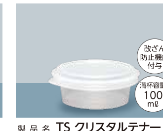
製品名 TS クリスタルテナー S サイズ 口径:92.7 全高:35.9 (mm) 首下径:76.0 底径:69.8 ケース入数 本体・蓋 / 各300 個 加飾 インモールドラベル(蓋のみ)