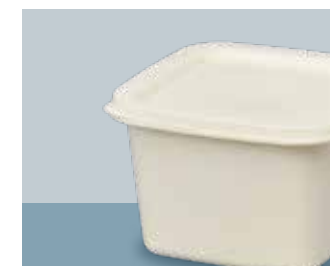
製品名 TS 1kg(正方形) サイズ 口径:151.2×186.5 全高:97.2 (mm) 首下径:133.1×164.0 底径:112.5×143.3 ケース入数 本体200 個 / 蓋400 個