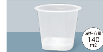
製品名 TS 71-67-140 サイズ 口径:72.5 全高:67.0 (mm) 首下径:63.0 底径:53.2×45.0 ケース入数 1,350 個 加飾 インモールドラベル