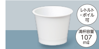
製品名 TS 71-54-107 サイズ 口径:70.0 全高:54.0 (mm) 首下径:63.4 底径:49.7 ケース入数 1,200 個 加飾 インモールドラベル