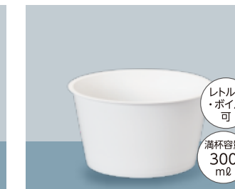
製品名 TS 100-55-300 サイズ 口径:100.0 全高:55.2 (mm) 首下径:93.7 底径:75.2 ケース入数 1,000 個 加飾 インモールドラベル