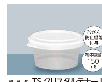
製品名 TS クリスタルテナー L サイズ 口径:92.7 全高:48.1 (mm) 首下径:76.0 底径:69.7 ケース入数 本体・蓋 / 各300 個 加飾 インモールドラベル(蓋のみ)