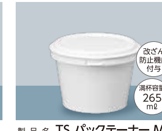
製品名 TS パックテナー M サイズ 口径:98.0 全高:63.0 (mm) 首下径:86.6 底径:70.4 ケース入数 本体・蓋 / 各800 個 加飾 インモールドラベル