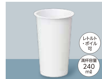
製品名 TS 71-110-240 サイズ 口径:70.3 全高:110.0 (mm) 首下径:63.5 底径:49.2 ケース入数 600 個 加飾 インモールドラベル