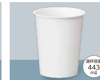
製品名 TS 88-115-340 サイズ 口径:87.7 全高:114.5 (mm) 首下径:80.7 底径:64.6 ケース入数 540 個 加飾 インモールドラベル