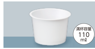
製品名 TS 71-49-110 サイズ 口径:71.0 全高:49.0 (mm) 首下径:63.2 底径:53.4 ケース入数 1,800 個 加飾 ダイレクト印刷