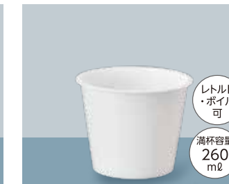
製品名 TS 88-70-260 サイズ 口径:87.7 全高:70.0 (mm) 首下径:80.7 底径:61.3 ケース入数 600 個 加飾 インモールドラベル