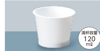
製品名 SK 71-55-120 (Xカップ) サイズ 口径:70.5 全高:54.9 (mm) 首下径:64.2 底径:51.4 ケース入数 1,600 個 加飾 ダイレクト印刷