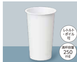
製品名 TS 71-110-250 サイズ 口径:70.3 全高:110.0 (mm) 首下径:63.0 底径:48.9 ケース入数 840 個 加飾 インモールドラベル