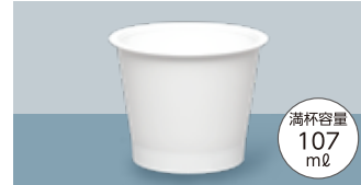
製品名 TS 71-55-107 サイズ 口径:70.0 全高:55.1 (mm) 首下径:63.2 底径:49.3 ケース入数 1,440 個 加飾 ダイレクト印刷