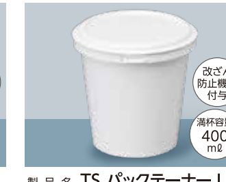
製品名 TS パックテナー L サイズ 口径:98.0 全高:92.0 (mm) 首下径:86.6 底径:68.2 ケース入数 本体・蓋 / 各800 個 加飾 インモールドラベル