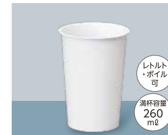
製品名 TS 75-97-260 サイズ 口径:74.3 全高:96.7 (mm) 首下径:68.3 底径:55.7 ケース入数 552 個 加飾 インモールドラベル