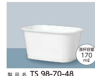
製品名 TS 98-70-48 サイズ 口径:98.2×69.1 全高:48.4 (mm) 首下径:89.8×61.6 底径:74.6×46.1 ケース入数 1,000 個 加飾 インモールドラベル