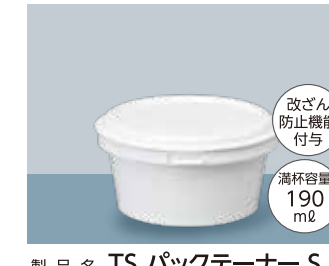
製品名 TS パックテナー S サイズ 口径:98.0 全高:44.0 (mm) 首下径:86.6 底径:75.6 ケース入数 本体・蓋 / 各800 個 加飾 インモールドラベル