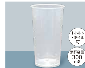
製品名 TS 71-123-300 サイズ 口径:70.5 全高:122.8 (mm) 首下径:64.0 底径:51.7 ケース入数 600 個 加飾 インモールドラベル