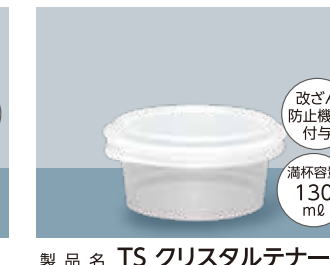
製品名 TS クリスタルテナー M サイズ 口径:92.7 全高:43.0 (mm) 首下径:76.0 底径:69.8 ケース入数 本体・蓋 / 各300 個 加飾 インモールドラベル(蓋のみ)